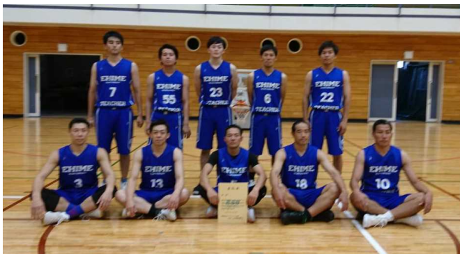
初優勝 愛媛教員クラブ