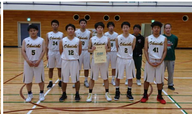
準優勝 大西クラブ

両チームは平成31年1月20日・21日に県立砥部総合体育館で開催される 第1回 全日本社会人バスケットボール選手権大会四国ブロックに出場