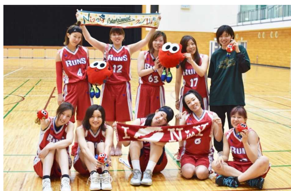
準優勝 らんずクラブ

両チームは平成31年1月20日・21日に県立砥部総合体育館で開催される第1回 全日本社会人バスケットボール選手権大会四国ブロックに出場