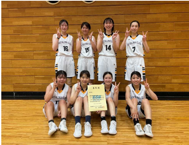
女子3位 カタリナクラブ